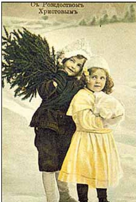
Почтовая открытка, нач. XX ст.