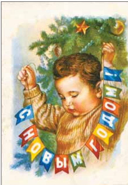
Почтовая открытка, 1936 г.

порядок труда и отдыха, но главным образом нарушается правильность нашего питания. Приготовляя праздничный обед, хозяйкам следует прежде всего иметь в виду не обилие блюд и не плотность их, а изысканность и разнообразие, в чем именно и долж-на сказаться их праздничная исключительность. Любимые многими традиционный гусь и поросенок должны чередоваться с легкими, вегетарианскими кушаньями, для того чтобы ослаблялось до некоторой степени их далеко не благотворное влияние на желудок».