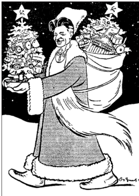
П. П. Постышев. Рис. Б. Ефимова, 1935 г.